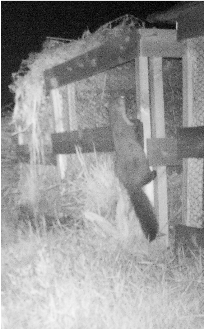
Een Steenmarter is erg handig en een goede klimmer

De Nieuwe Kloostertuin Tildonk vzw wil haar verantwoordelijkheid opnemen met een verantwoorde kippenren op haar domein!